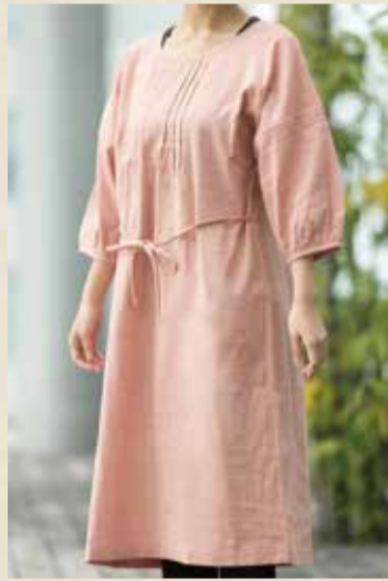
ラウンドネックワンピース