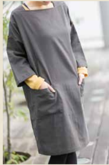
スクエアワンピース