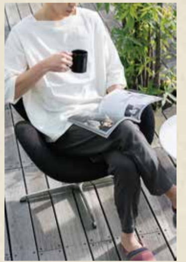
スクエアシャツ+サルエルパンツ